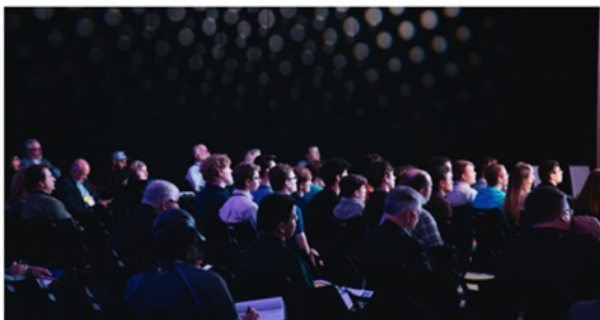
International Congress API – Advances in the Packaging Industry “Sustainability: Products and Processes”

Czwarta edycja Międzynarodowego Kongresu API - Postępy w Przemśle Opakowań „Sustainability: Products and Processes”, która odbędzie się w Neapolu w dniach 24 i 25 listopada 2022 roku.